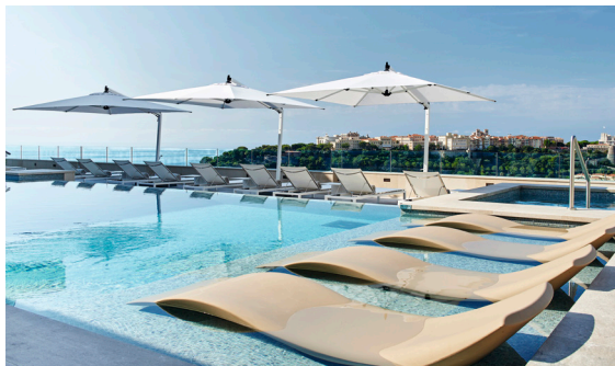
Wellness Sky Club, Hôtel de Paris Monte-Carlo

Tous nos hôtels 4 et 5 étoiles offrent des moments de détente privilégiés et le plaisir naturel d'un spa. Reliés à l'Hôtel de Paris Monte-Carlo et à l'Hôtel Hermitage Monte-Carlo, les Thermes Marins Monte-Carlo prodiguent des soins pour la beauté, la silhouette et la performance.