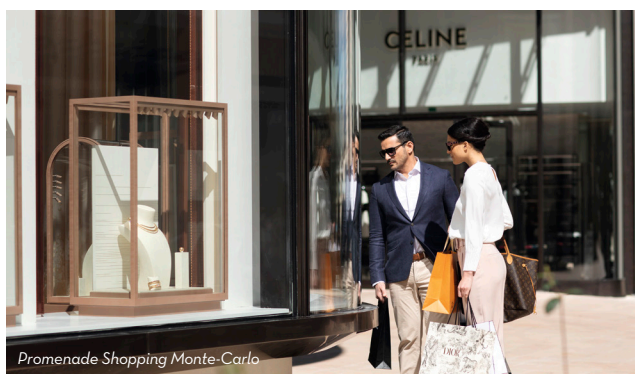
Promenade Shopping Monte-Carlo

Autour du Casino de Monte-Carlo, entre haute couture et haute joaillerie, 60 enseignes du luxe mettent en scène les collections de griffes prestigieuses. Au détour du tracé du Formula 1 Grand Prix de Monaco et de la Promenade Monte-Carlo shopping se dessine une expérience unique sur la Riviera.